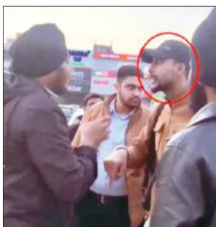
पैसे मांगने पर युवकों से बहस करता मुलाजिम

जालंधर/यूटर्न/25 जनवरी। जालंधर में बाइक रोकने और चालान काटने पर हंगामा हो गया। शक होने पर बाइक सवार युवकों ने वीडियो बनानी शुरू कर दी। इस पर नाका लगाने वाले पुलिसकर्मी भड़क गए। शक होने पर बाइक सवार ने जब उनके आईडी की मांग की तो वे सकपका गए। युवक का शक बढ़ा तो उसने शोर मचाते हुए आसपास के लोगों को इकट्ठा कर लिया। भीड़ बढ़ने और वीडियो बनता देख नाका लगाने वाले पुलिसकर्मी और उसके साथ आए 2 युवक मौके से भाग निकले। इसके बाद लोगों ने लोकल थाने से पुलिस कर्मियों और नाके की जानकारी जुटाई। थाने से पता चला कि ना तो किसी पुलिस कर्मी को नाका लगाने की जिम्मेदारी दी गई और ना ही जिस जगह चेकिंग की जा रही थी, वहां कोई नाका लगाने की