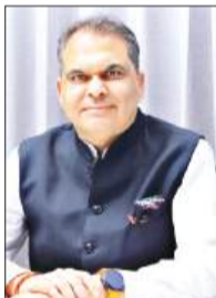
मंत्री संजीव अरोड़ा