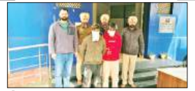
पेज 08 अवैध हथियार व कारतूस सहित दो युवक गिरफ्तार...