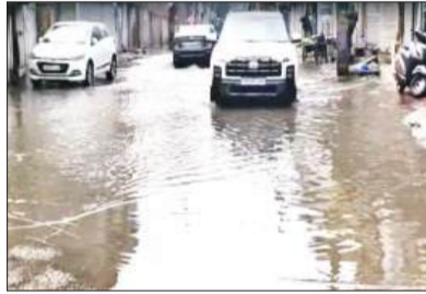
शहर की सड़क पर भरा पानी