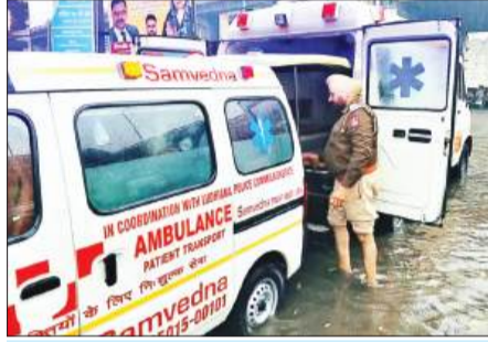
ढोलेवाल पानी में खराब हुई एम्बुलेंस से मरीज को दूसरी एम्बुलेंस में शिफ्ट करते मुलाजिम

लुधियाना/यूटर्न/23 जनवरी। लुधियाना में वीरवार रात से शुरू शहर में जमकर बारिश हो रही है। शुक्रवार को पूरा शहर पानी पानी हो गया। इलाके, चौक व सड़कों पर पानी भरने के कारण लोगों को बेहद परेशानी झेलनी पड़ी। बेशक लुधियाना की मेयर व अफसरों द्वारा शहर का ड्रेनेज सिस्टम दुरुस्त करने के दावे किए जाते हैं। लेकिन एक बारिश ने ही उक्त दावों की हकीकत निकालकर सामने रख दी। इस बारिश ने लुधियाना कारपोरेशन की पोल तो तब खोली जब लोकल बॉडी विभाग के मंत्री संजीव अरोड़ा की गुरदेव नगर स्थित रिहायश के बाहर सड़क धंस गई। इस घटना ने भ्रष्ट अफसरों और ठेकेदारों का सच सामने लाकर रख दिया। वहीं एक तरफ कुछ दिन पहले कैबिनेट मंत्री संजीव अरोड़ा को लोकल बॉडी विभाग मिला है। जबकि उन्हें चार्ज मिलते ही कहीं न कहीं कारपोरेशन के भ्रष्ट अफसरों की साढ़ेसाती शुरू हो गई है। जहां लीडर भ्रष्टाचार रोकने के लिए अफसरों की गलतियां ढूँढते हैं। वहीं इस मामले में अफसरों-ठेकेदारों की गलती खुद ब खुद चलकर सामने आ गई। जिसे देख लगता है कि कहीं न कहीं अब गलत कार्य करने वाले अफसरों का बुरा समय शुरू हो गया है। अब देखना होगा कि मंत्री अरोड़ा द्वारा इस मामले में क्या एक्शन लिया जाता है।