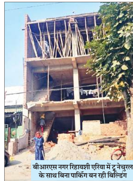
बीआरएस नगर रिहायशी एरिया में टूनेचुरल के साथ बिना पार्किंग बन रही बिल्डिंग