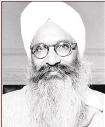
पूर्व मुख्यमंत्री प्रताप सिंह कैरों

चंडीगढ़/यूटर्न/29 दिसंबर। पंजाब, जो कभी एंटरप्रेन्योरशिप और मैनुफैक्चरिंग का गढ़ था, खासकर लुधियाना, अपनी इंडस्ट्रियल विरासत को वापस पाने के लिए एक नई कोशिश कर रहा है। लुधियाना में टेक्सटाइल करघों की गूंज से लेकर साइकिल फैक्ट्रियों की खड़खड़ाहट तक, जिसने कभी राज्य को दुनिया भर में पहचान दिलाई थी, पंजाब के उद्योग लंबे समय से इसकी अर्थव्यवस्था और रोजगार की रीढ़ रहे हैं। हालांकि, दशकों की चुनौतियों, जिसमें आतंकवाद का असर, पॉलिसी में अनिश्चितता, लॉजिस्टिक्स की दिक्कतें, और आर्थिक रुकावटें शामिल हैं, ने इस गति को धीमा कर दिया और इंडस्ट्रियल ठहराव और निवेश के बाहर जाने की चिंताएं पैदा कर दीं। पंजाब के फॉर्मर चीफ मिनिस्टर्स लैट परताप सिंह कैरों के कोशिशों के बाद अब यह कहानी बदलने लगी है। मुख्यमंत्री भगवंत मान के नेतृत्व वाली आम आदमी पार्टी सरकार के तहत, पंजाब इंडस्ट्रियल मोर्चे पर नया आशावाद देख रहा है। इस रिवाइवल की कोशिश के केंद्र में उद्योग मंत्री संजीव अरोड़ा हैं, जो निवेशकों के साथ सक्रिय रूप से जुड़ रहे हैं, नीतियों में सुधार कर रहे हैं, और मैनुफैक्चरिंग, टेक्सटाइल, केमिकल्स, आईटी, और उभरती टेक्नोलॉजी जैसे सेक्टरों में बड़े निवेश के वादे हासिल कर रहे हैं।