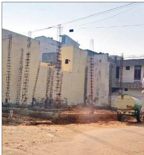
बीआरएस नगर ब्लॉक-आई में गुरु नानक इंटरनेशनल स्कूल के अपोजिट बन रही अवैध इमारत