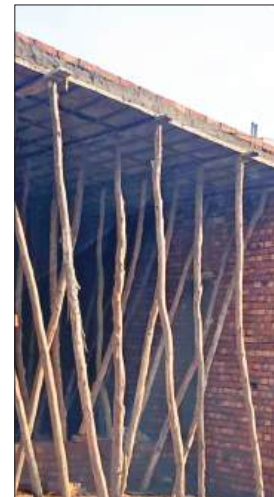
सीएफसी स्कूल रोड पर बन रही नॉन कंपाउंडेबल बिल्डिंग