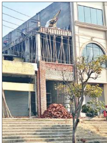
सीएफसी स्कूल रोड पर बन रही नॉन कंपाउंडेबल बिल्डिंग