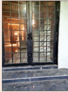
शाम करीब 8 बजे टूटी सील

वहीं लोगों में चर्चा है कि पक्खोवाल रोड स्थित हीरो बेकरी को भी सितंबर 2023 में सील किया गया था। मालिक ने सील तोड़ दी। निगम अफसरों ने कोई एक्शन नहीं लिया। फिर विवाद बढ़ने पर खानापूर्ति के लिए दो साल बाद एफआईआर कर दी। जिसमें गिरफ्तारी भी नहीं हो सकी। चर्चा है कि क्या अब इस मामले में भी निगम दो साल बाद एफआईआर करवाएगी।