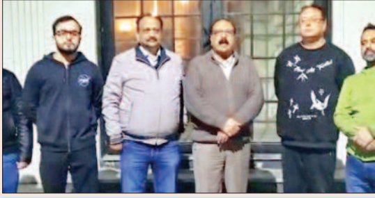
पुलिस को दी शिकायत की जानकारी देते इलाका निवासी