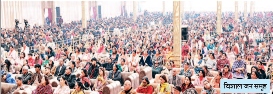
विशाल जन समूह