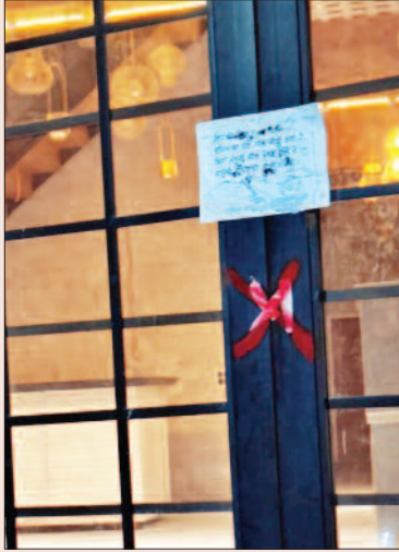
शनिवार शाम करीब छह बजे तीसरी बार सील किया होटल

आज कल शहर में निगम द्वारा सील की जाने वाली बिल्डिंगों की सीलें अक्सर ही टूटने की बातें सामने आती रहती हैं। ज्यादातर सीलें बाहुबलियों की बिल्डिंगों की ही टूटती हैं। चर्चा है कि निगम अफसरों की पहले बाहुबलियों से सेटिंग होती है, जिसके बाद उक्त अफसर ही सीलें तुड़वा देते हैं। तभी बाद में वह एफआईआर